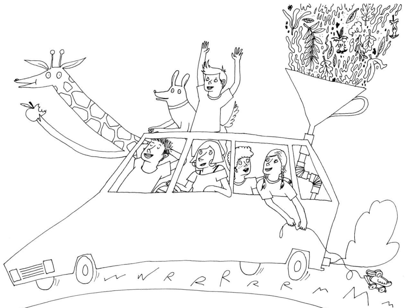
Illustration: Kooni.ch für fahrBiogas Energie-Genossenschaft